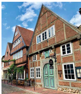
Abb.: © Sabine Hilsen